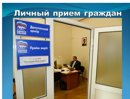
График личного приема депутатами населения утверждается представительными органами муниципальных образований Хабаровского края или его председателями исходя из удобства времени для избирателей и потребности производственной работы депутатов, работающих на непостоянной основе. Регулярность депутатского приема составляет - не реже одного раза в месяц. Мы принимаем в Думе еженедельно, а на территории избирательных округов – 1-2 раза в месяц.

8. приглашение жителей участвовать в заседании представительного органа.