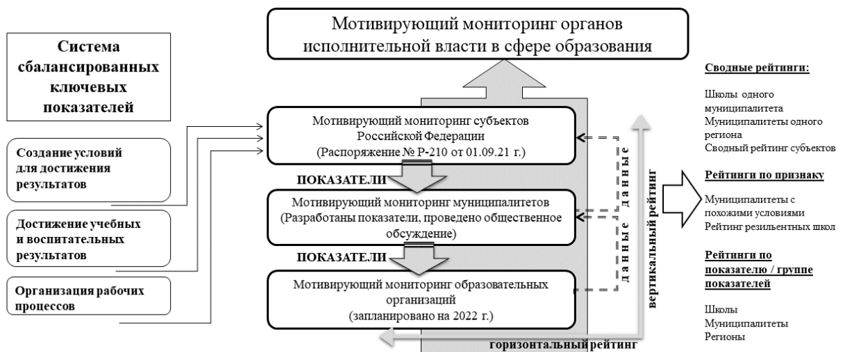
Рис. 3. Структурная модель мотивирующего мониторинга

Структурная модель мотивирующего мониторинга представлена на рис. 3;