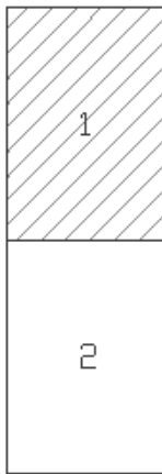
Схема расположения листов