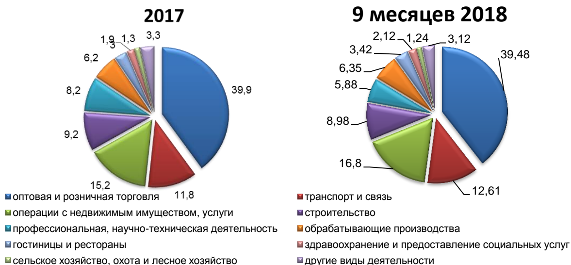
Рисунок 2– Структура субъектов МСП по видам экономической деятельности за 2017-2018 гг., процентов

В структуре малого и среднего бизнеса за 9 месяцев 2018 году по сравнению с аналогичным периодом 2017 года существенных изменений не произошло. Сократилась доля предприятий профессиональной и технической деятельности на 2,56 %. За 9 месяцев 2018 года незначительно увеличилась доля предприятий транспорта и связи – на 0,51% и предприятий в отрасли здравоохранения и предоставления социальных услуг – на 0,28%.